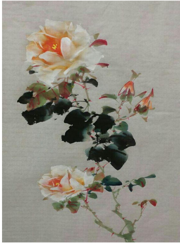
화조화 цветы и птицы